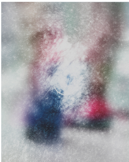
untitled ,2018, 186mm×149mm Ink,acrylic,watercolor and pastel on paper