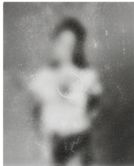
untitled, 2018, 372mm×298mm Ink,acrylic,watercolor and pastel on paper