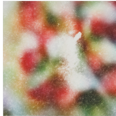
untitled ,2018, 149mm×149mm Ink,acrylic,watercolor and pastel on paper